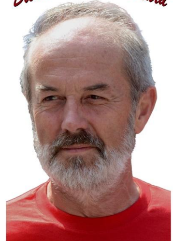
25e wandeling Diekirch - Valkenswaard 19-08-2017 t/m 26-08-2017